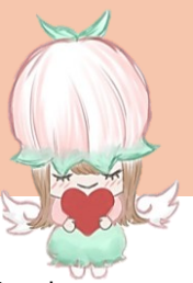
公式キャラクター まもちゃん