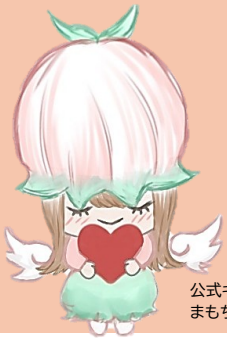
公式キャラクター まもちゃん